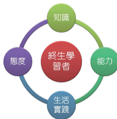
新課綱的基本涵義

過去以學習知識為目的，未來要求學生不僅學知識，還要能將知識運用和實踐於生活之中。目的在於培養「終身學習者」，能自主選擇適合的學習方式，並且對於日常遇到的問題，能夠進行系統性思考和判斷；能運用各種工具及管道與人溝通，並且有效與人互動；能具備社會多元性，了解文化差異