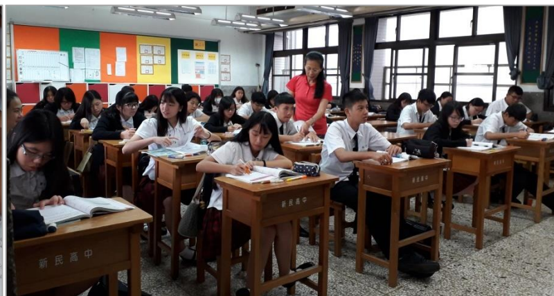
(6) 老師巡視檢視學生學習狀況