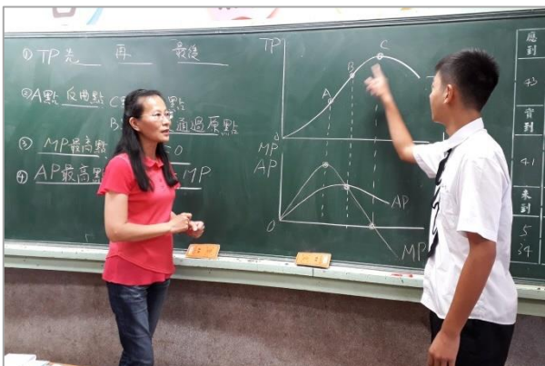
(7) 指定學生上台講解