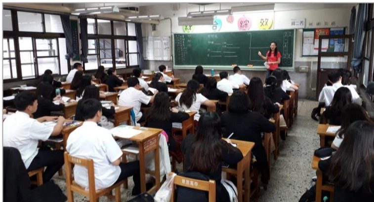
(1) 老師提示本章重點