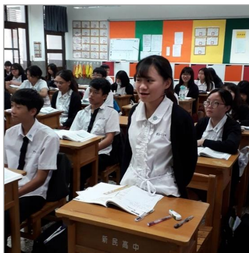
(3) 指定學生回答問題