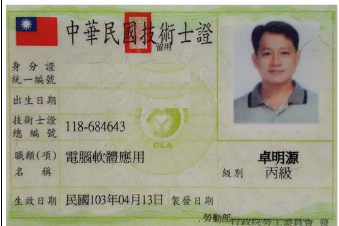
電腦軟體應用丙級