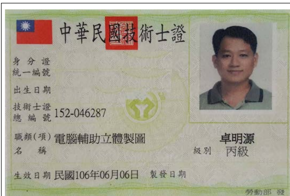
電腦輔助立體製圖丙級