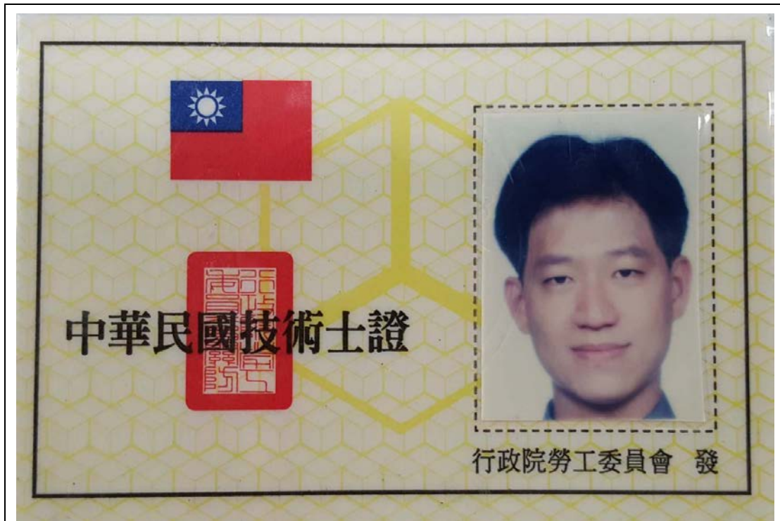
電腦輔助機械製圖乙級 (正面)