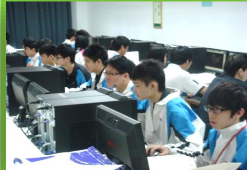
電腦輔助製圖實習