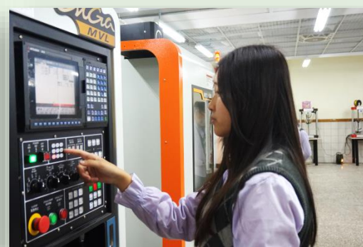
數值控制機械實習